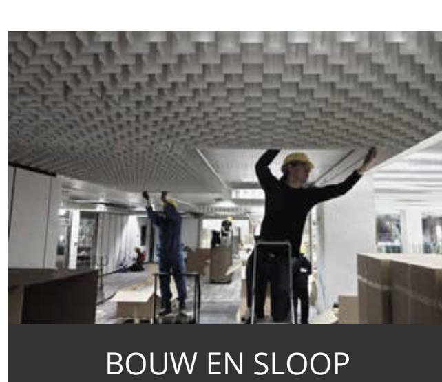
BOUW EN SLOOP