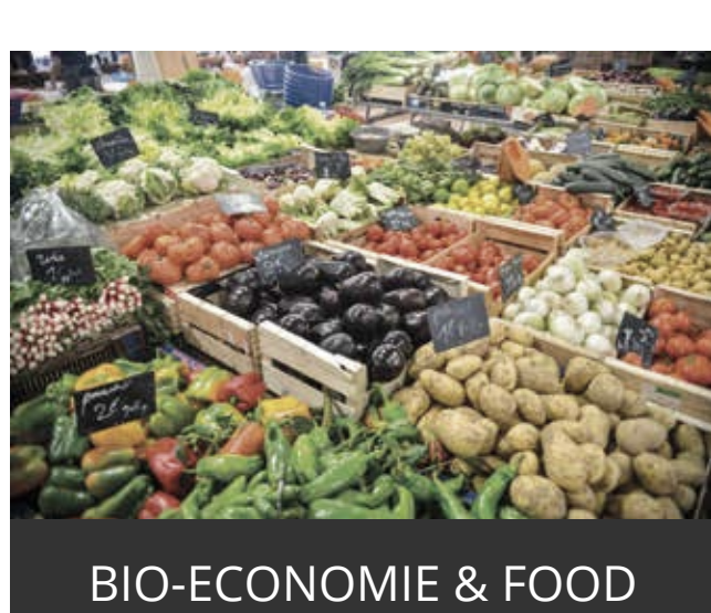
BIO-ECONOMIE & FOOD